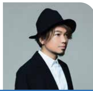
馮翰銘 | 監製導師